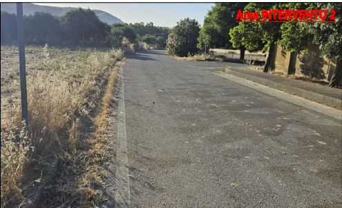
SITUAZIONE DI PROGETTO - Inviduazione tratto di intervento